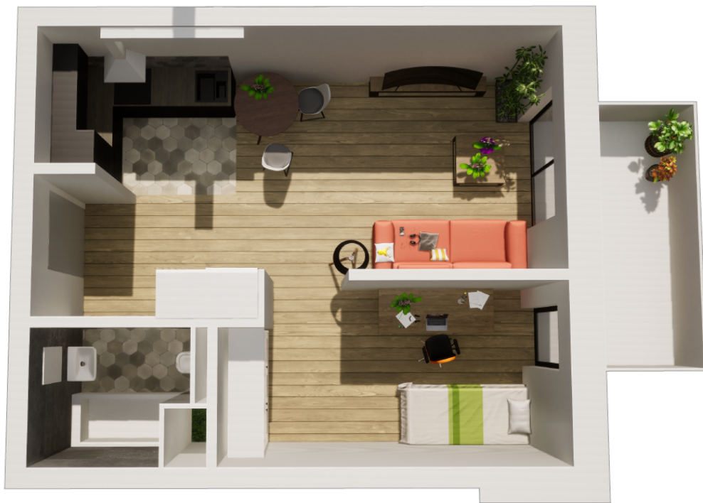
MIESZKANIE WIDOK WNĘTRZA PERSPEKTYWA