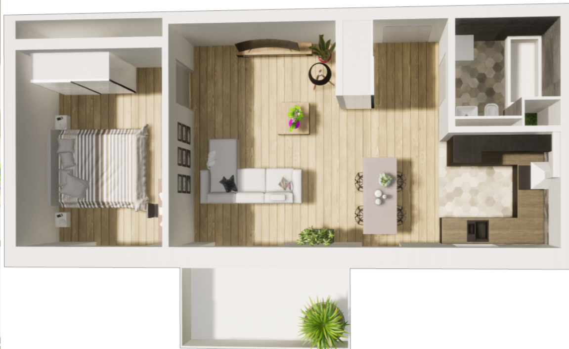
MIESZKANIE WIDOK WNĘTRZA PERSPEKTYWA