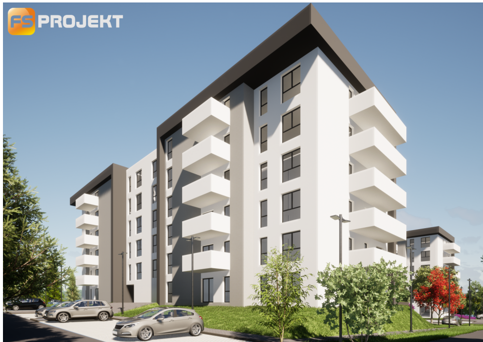
BUDYNEK NR 3 WIDOK OD STRONY WEJŚCIA